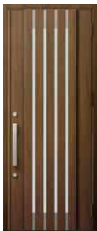
型番：M27 カラー：クリエモカ