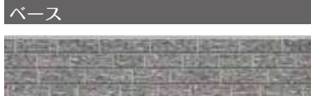
オーバルストーン QF オピリチタングレー