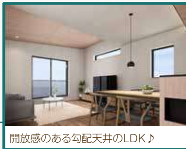
開放感のある勾配天井のLDK♪