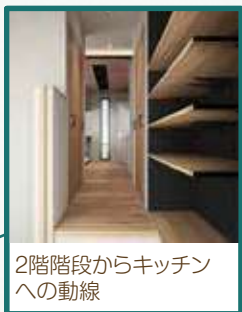
2階階段からキッチンへの動線