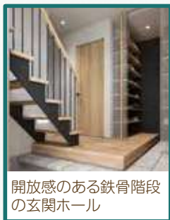
開放感のある鉄骨階段の玄関ホール